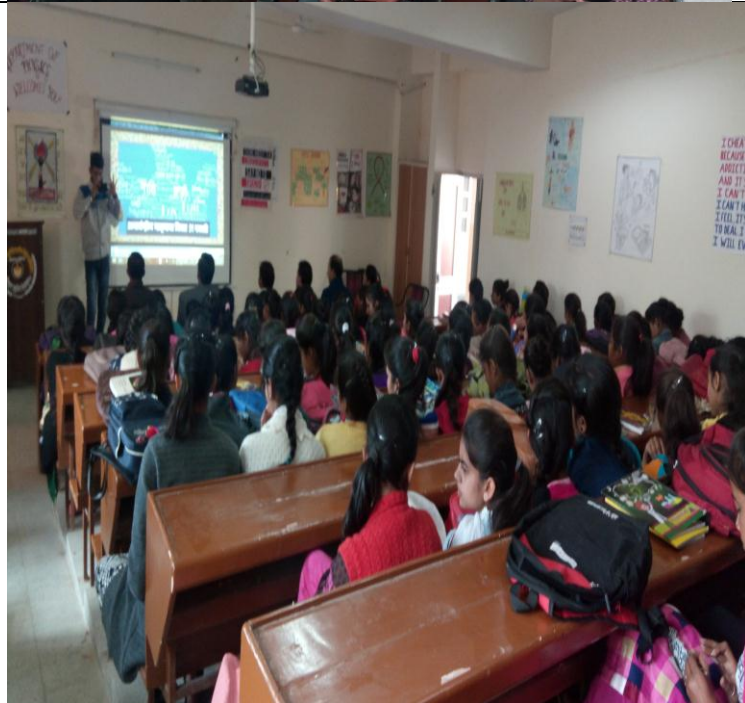
Visualization of documentary Film on International mother Language.